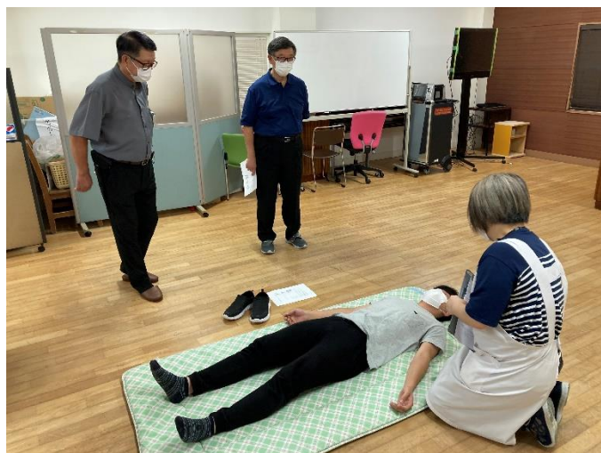
<救命救急訓練の様子>

今年はコロナ禍でしたので、地域住民を招いての訓練はできませんでしたが、避難経路や備蓄・設備等を再度確認し、災害への備えをしました。