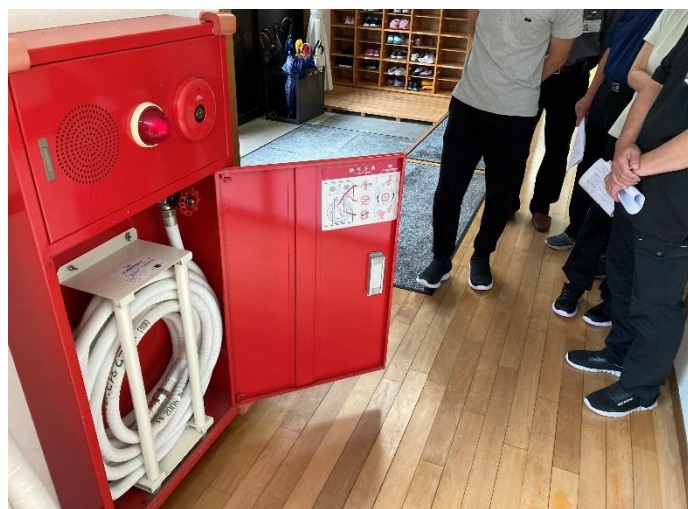
<消火設備の確認の様子>