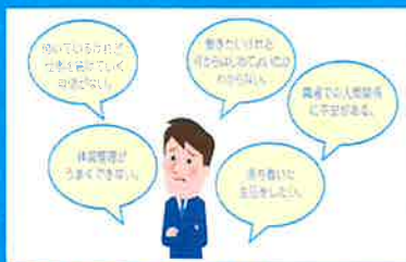
障害のある人へのお手伝い

身近な地域で、ハローワークや障害者職業センター、福祉施設、特別支援学校など関係機関との連携拠点として、障害のある人ご自身やご家族からのご相談に応じ、職業訓練、就業活動、職業の定着、日常生活の安定など、就業及びこれに伴う日常生活、社会生活上のサポートを一体的に行っています。