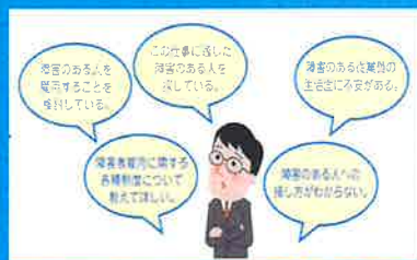
事業者へのお手伝い