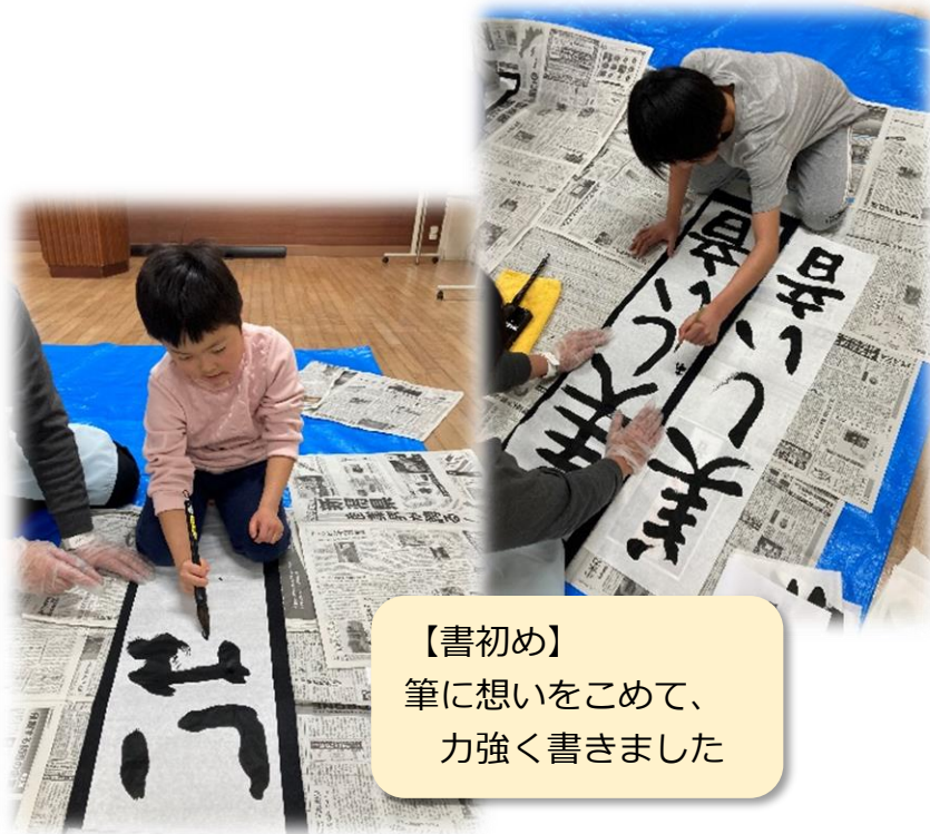
【書初め】 筆に想いをこめて、 力強く書きました