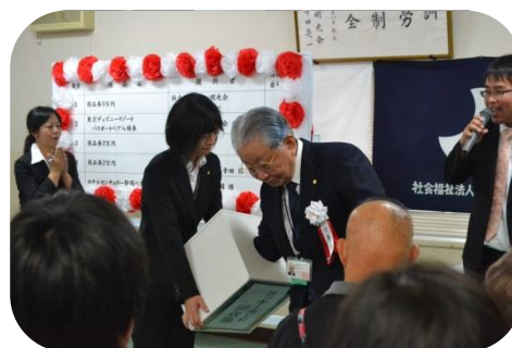
ラッキーカード抽選会