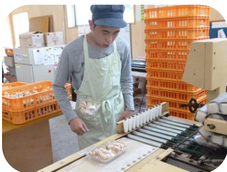
よしもとファーム

職場実習を通じて、働くことの意味を考え働く姿勢を学びます。けやきワークセンターで行ってきた訓練の実践の場とし、就職に対する自信や意欲を高めています。