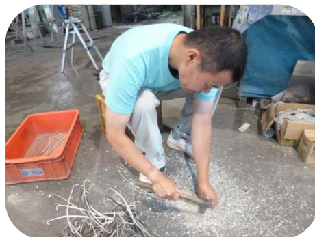
岸萬塗装株式会社