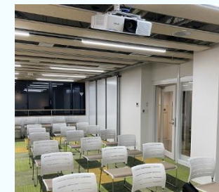
明るい学習スペース