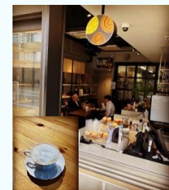
レキシア一階カフェフロア