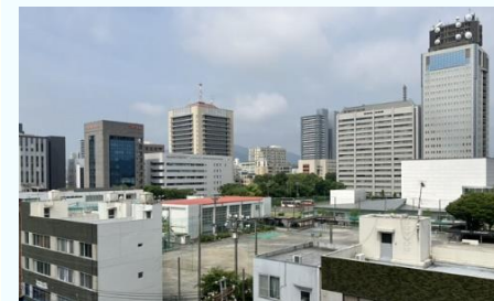
静岡市中心部近く